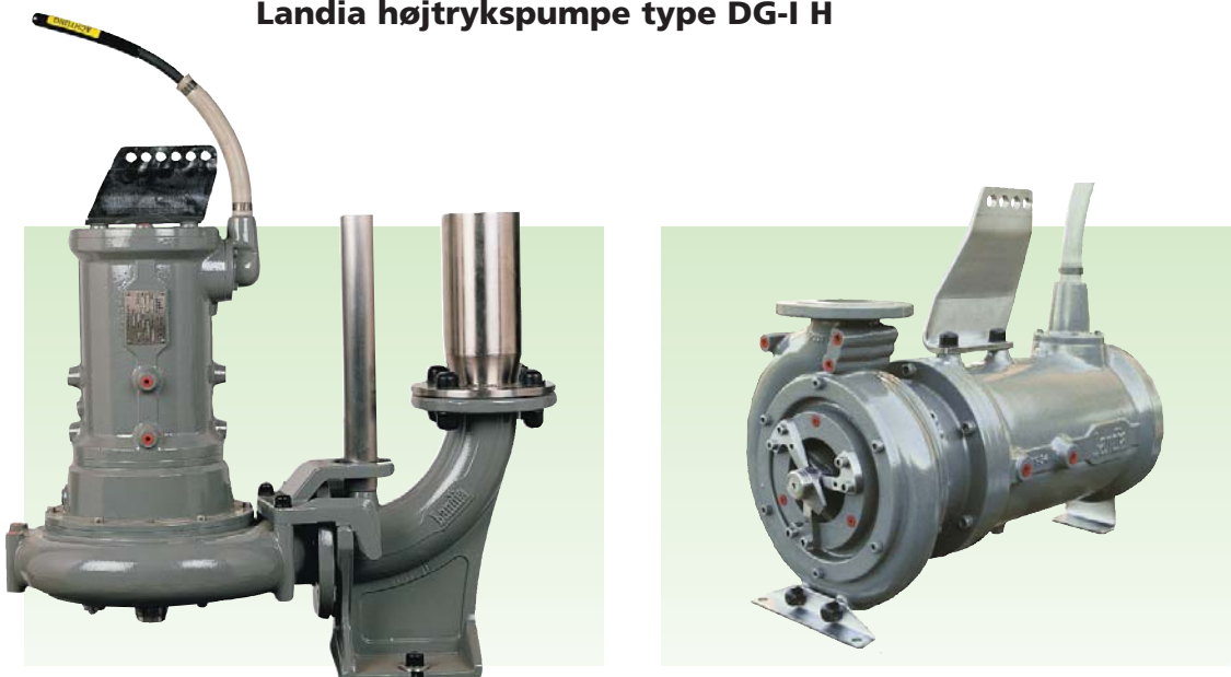
Landia højtrykspumpe type DG-I H

Pumpen er ideel til anvendelse i stærkt forurenede væsker, samt væsker med højt tørstofindhold, f.eks. industrispildevand, slam, pulp, fiskeaffald og organiske biprodukter. Pumpen er ligeledes velegnet til anvendelse i alle faser på biogasanlæg.